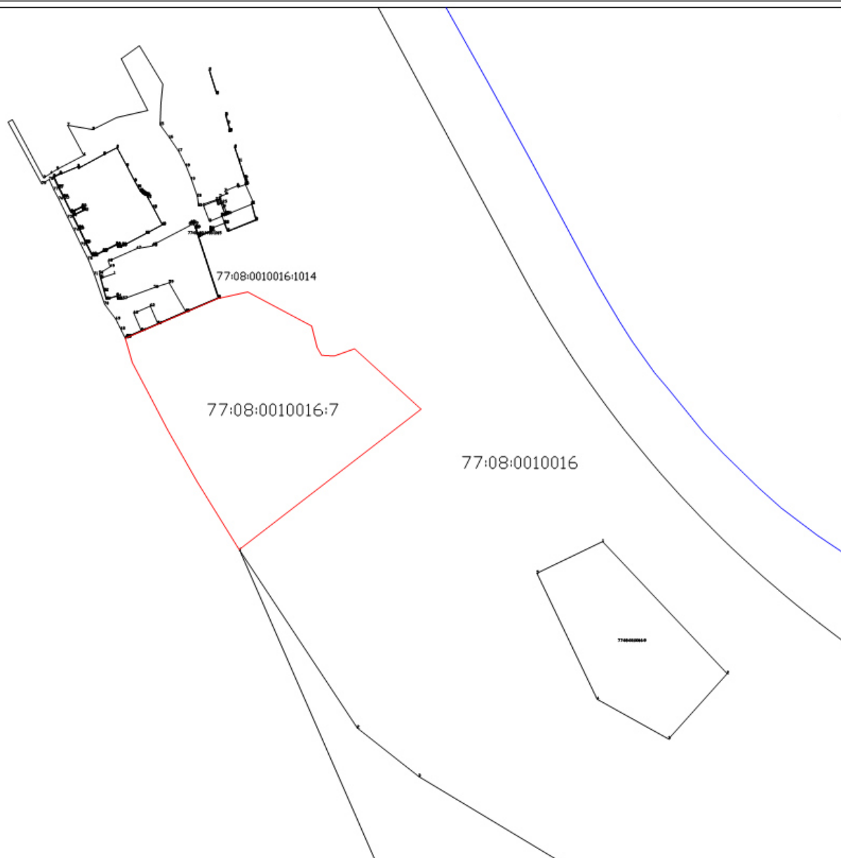
Схема расположения земельного участка